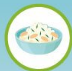
размоченный хлеб с творогом и зеленью

Важно помнить, что в основном подкармливать водоплавающих птиц нужно на специальных подкормочных площадках, расположенных на берегу водоемов (у кромки воды).