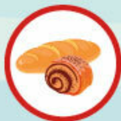
хлебом и сдобой