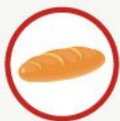
свежим белым хлебom