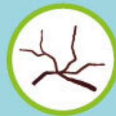
вымоченные в крепком расоле высушенные ветки