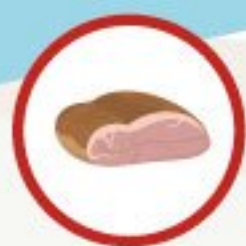
соленым перченым копченым