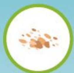
подсушенные крошки белого хлеба